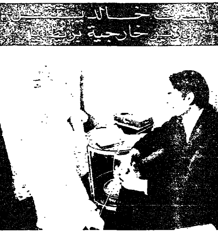
استقبل الملك خالد بن عبد العزيز في جناحه مستشفى ولغتون في لندن أمس الأول وزير خارجية بريطانيا الجديد نيفيد اوين السدي اطمان الى صحة المعامل السعودي